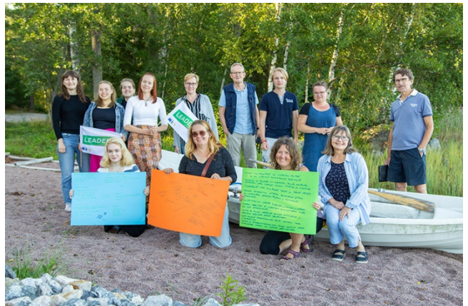
Kuva 6. Ravakan hallituksen, henkilökunnan ja nuorisotyöryhmän yhteinen strategiapäivä elokuussa 2020.